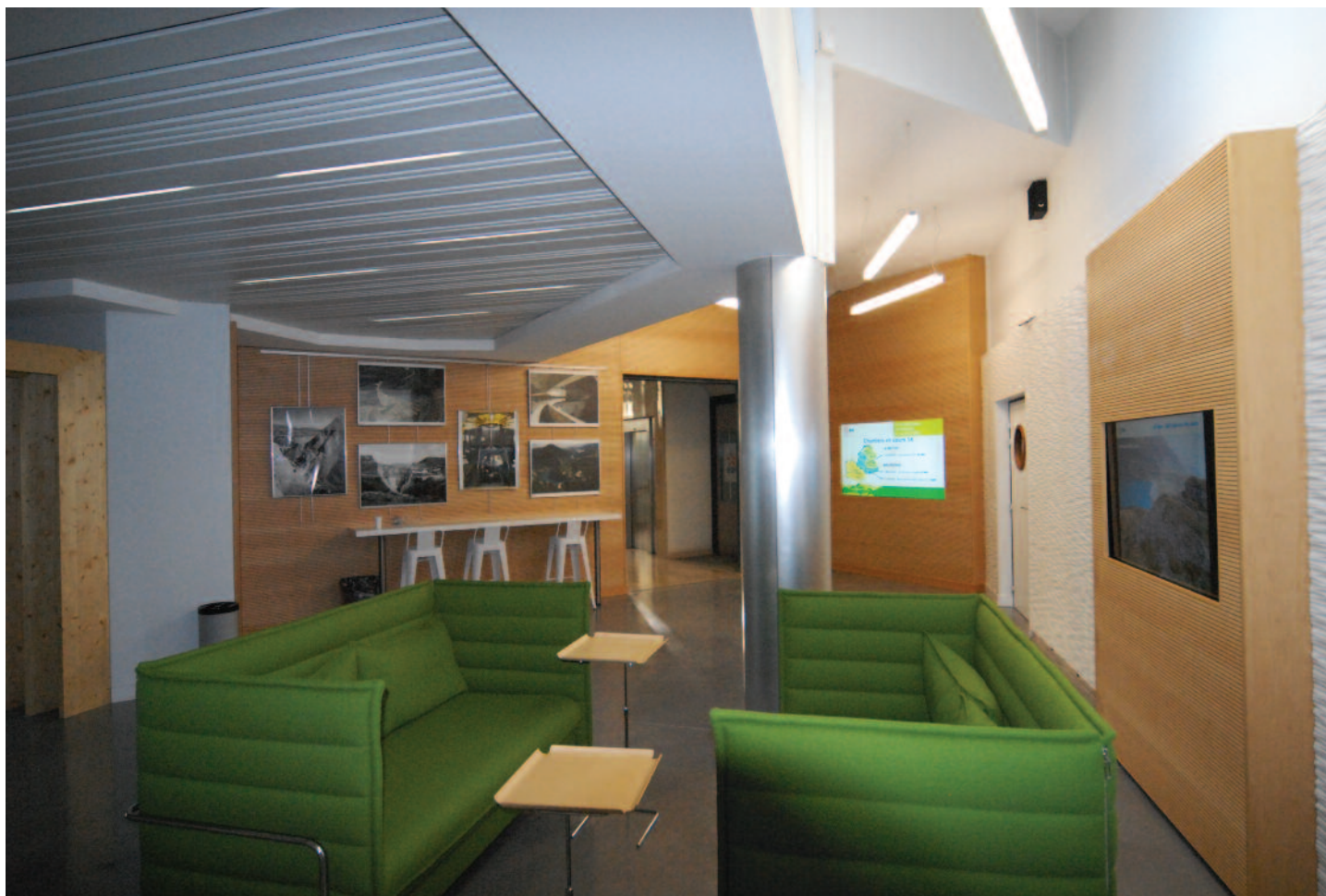
Vue générale de l'espace d'accueil

Conception + Économie + OPC : Atelier Philippe Jammet architecte