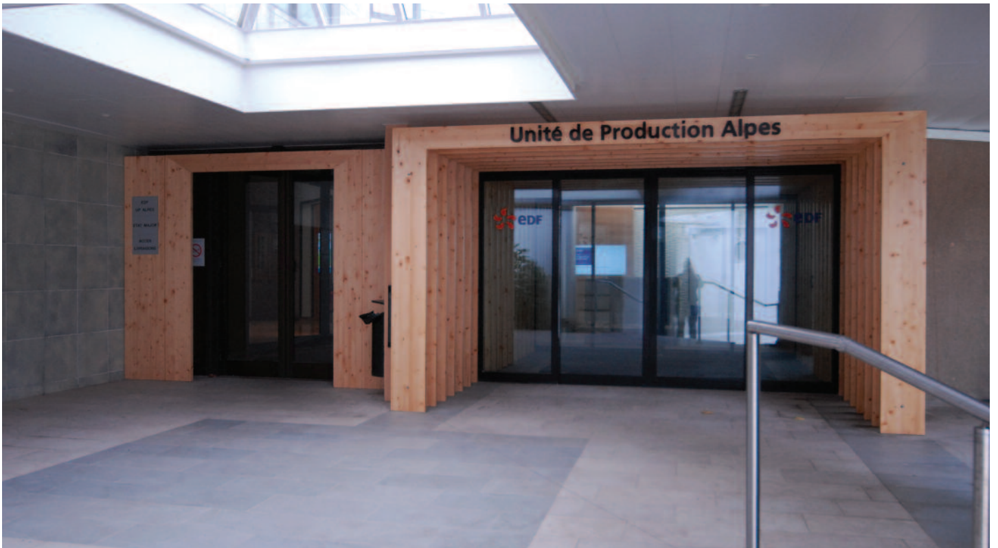
Vue depuis le parvis d'entrée