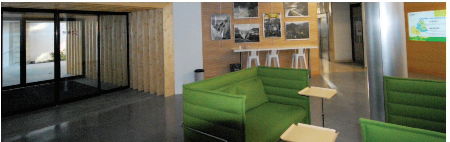
Vue générale du projet