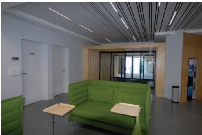
Espace accueil VIP