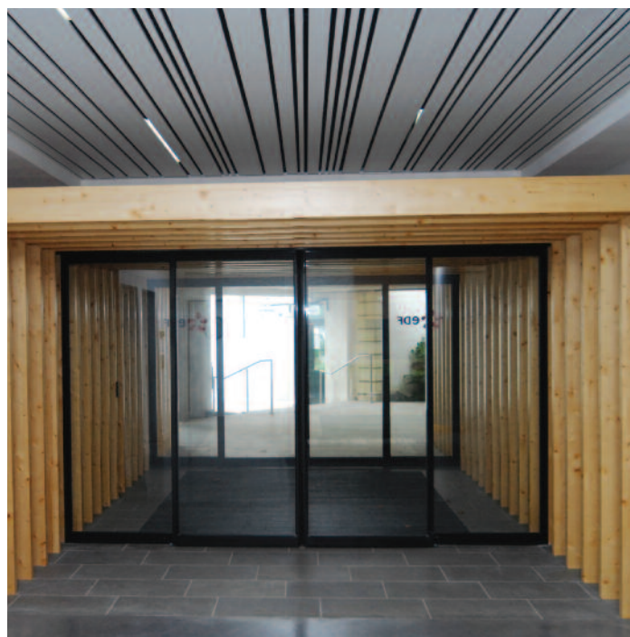
Détail de l'entrée

Réalisé en 2013, le projet de réaménagement de l'accueil de l'Unité de Production Alpes résulte de la volonté d'EDF d'accueillir les acteurs politico-économiques locaux dans un Hall-Show-room qui servira de support à toutes les déclinaisons visuelles des métiers d'EDF comme fournisseur d'énergie verte. La force hydraulique sera magnifiée au travers d'éléments multiples de communication dans une ambiance à forte dominante HQE.