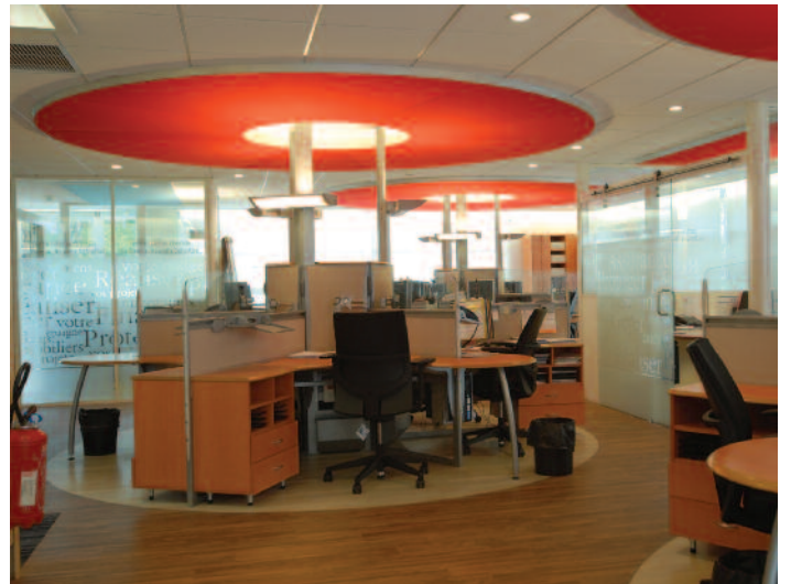
Rosaces et poste de travail – St-Martin-d'Hères