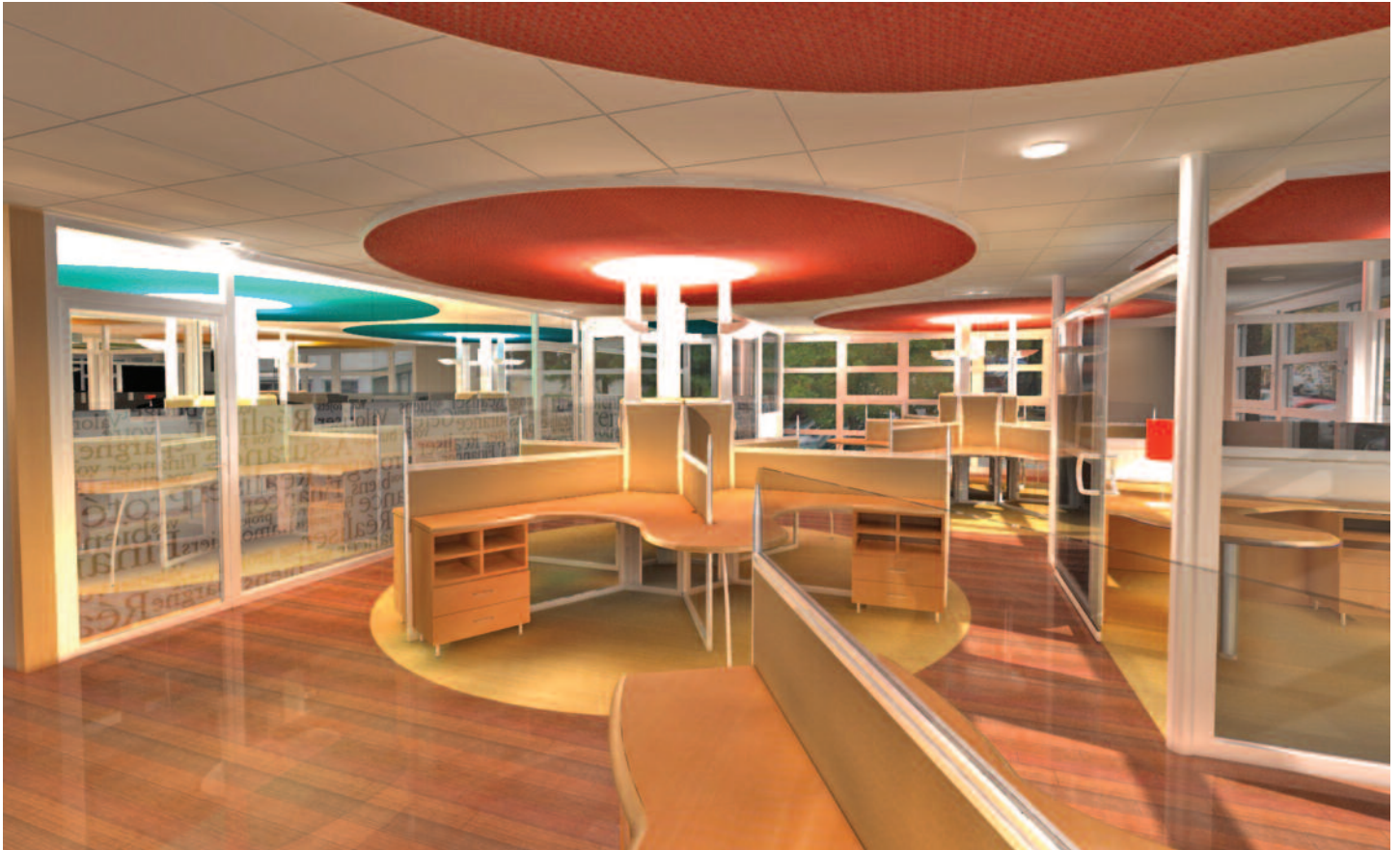
Vue d'ensemble du plateau de St-Martin-d'Hères

Localisation : sites de Grenoble et Lyon