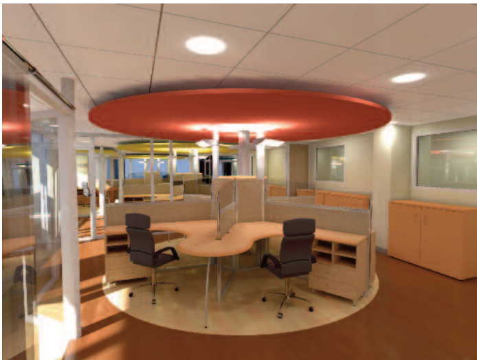
Perspective architecturale – Lyon