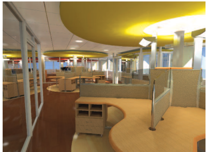
Rosaces et poste de travail – Lyon