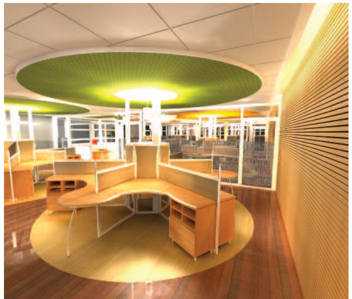
Perspective Architecturale – St-Martin-d'Hères

La Caisse d'Épargne Rhône-Alpes a confié à l'atelier Philippe Jammé architecte et Alchemy Design la restructuration intérieure de plusieurs plateaux de ses sites techniques. Les projets présentés correspondent à des centres névralgiques de la relation commerciale (CRC) associés à la Banque à distance (Mon banquier en ligne). Ces projets de design d'environnement touchent très directement les utilisateurs qui doivent être dans les meilleures dispositions ergonomiques puisque leur seul contact avec la clientèle est phonique : le « sourire » s'entend. Dans cet esprit, l'approche conceptuelle s'appuie sur l'aspect acoustique des lieux dans leur ensemble mais également sur tout ce qui permet à l'utilisateur d'obtenir le meilleur confort possible : absorption acoustique, ergonomie des postes de travail, environnement intérieur valorisant l'esprit d'unité des équipes commerciales, reconnaissance et adéquation à un univers de travail ludique mais tourné vers l'efficacité de l'accroche du « phoning » en terme à la fois de prospects et de réponses aux problématiques de la clientèle en ligne. Ces « Centres de Relations Commerciales » de Lyon et Grenoble synthétisent et concentrent l'ensemble des échanges téléphoniques du réseau de 320 points de vente de la Caisse d'Épargne Rhône-Alpes.