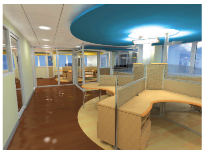
Vue d'ensemble – Lyon