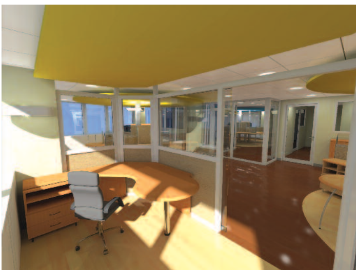
Vue d'ensemble – Lyon