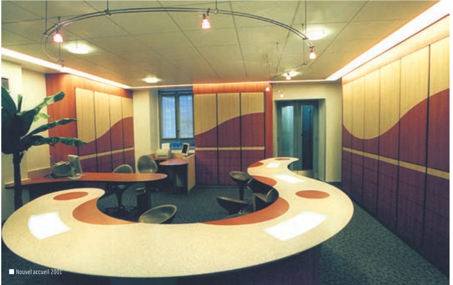
■ Nouvel accueil 2001