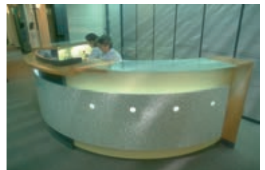
■ Accueil 1995