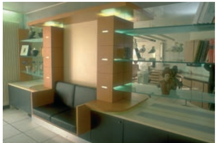
■ Banquette d'attente 1995

Après avoir restructuré l'accueil et les zones d'attente en 1995, le cabinet dentaire de M. Dupont-Ferrier recontacte notre agence en 2001 pour revoir l'ensemble de ce projet. La démolition de cloisonnements permet de revoir entièrement la disposition de ce nouvel espace. Il est décidé de recevoir différemment les patients avec un accueil debout-debout effectué par chaque assistante pour chaque chirurgien-dentiste associé. Les 4 postes d'accueil ainsi créés proposent une nouvelle dynamique matérialisée par un mobilier conçu sur mesure dans le cadre d'un Design d'environnement très convivial.