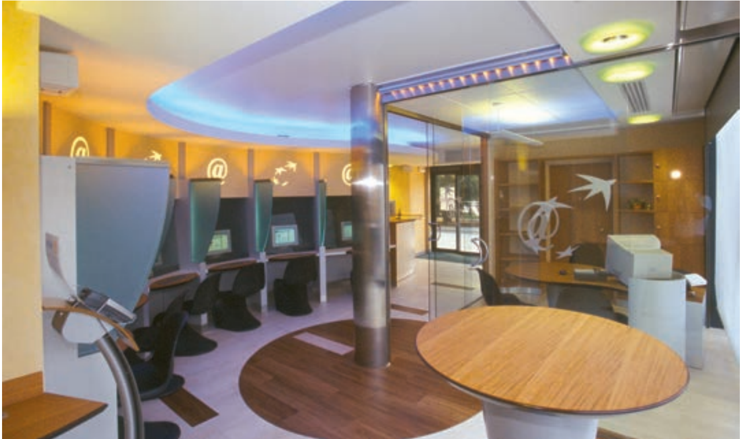
■ Vue d'ensemble de l'espace "Cyber"